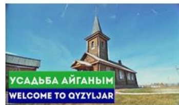
Рисонок 4. Интерактивная карта «Сакральные места Северо-Казахстанской области»

В 2017 году был инициирован проект «Заман таспасы». Проект предполагает собой установление охранных табличек с QR-кодом. На сегодняшний день установлено более 80 табличек.