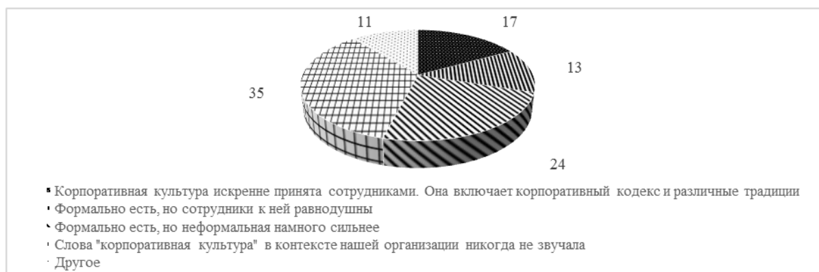
Рисунок 3 Общая тенденция отношения руководителей отечественных фирм и их сотрудников к понятию «корпоративная культура»

Из исследований видно, что более чем в 35% отечественных фирм термин «корпоративная культура» практически не употребляется, а в 24% компаний преобладает неформальная культура. Лишь в 17% предприятий принят данный термин и руководители стараются развивать корпоративную культуру своей организации. Это говорит о низком развитии данной составляющей бизнеса в нашей стране.