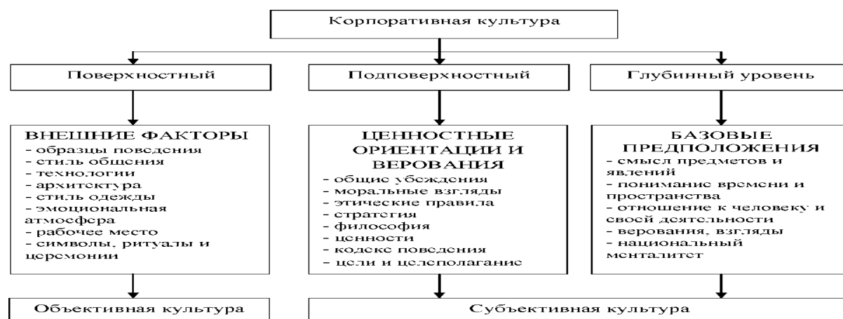
Рисунок 1 Уровни корпоративной культуры

Как правило, корпоративную культуру рассматривают на трех основных уровнях - поверхностном, подповерхностном и глубинном (Рисунок 1).